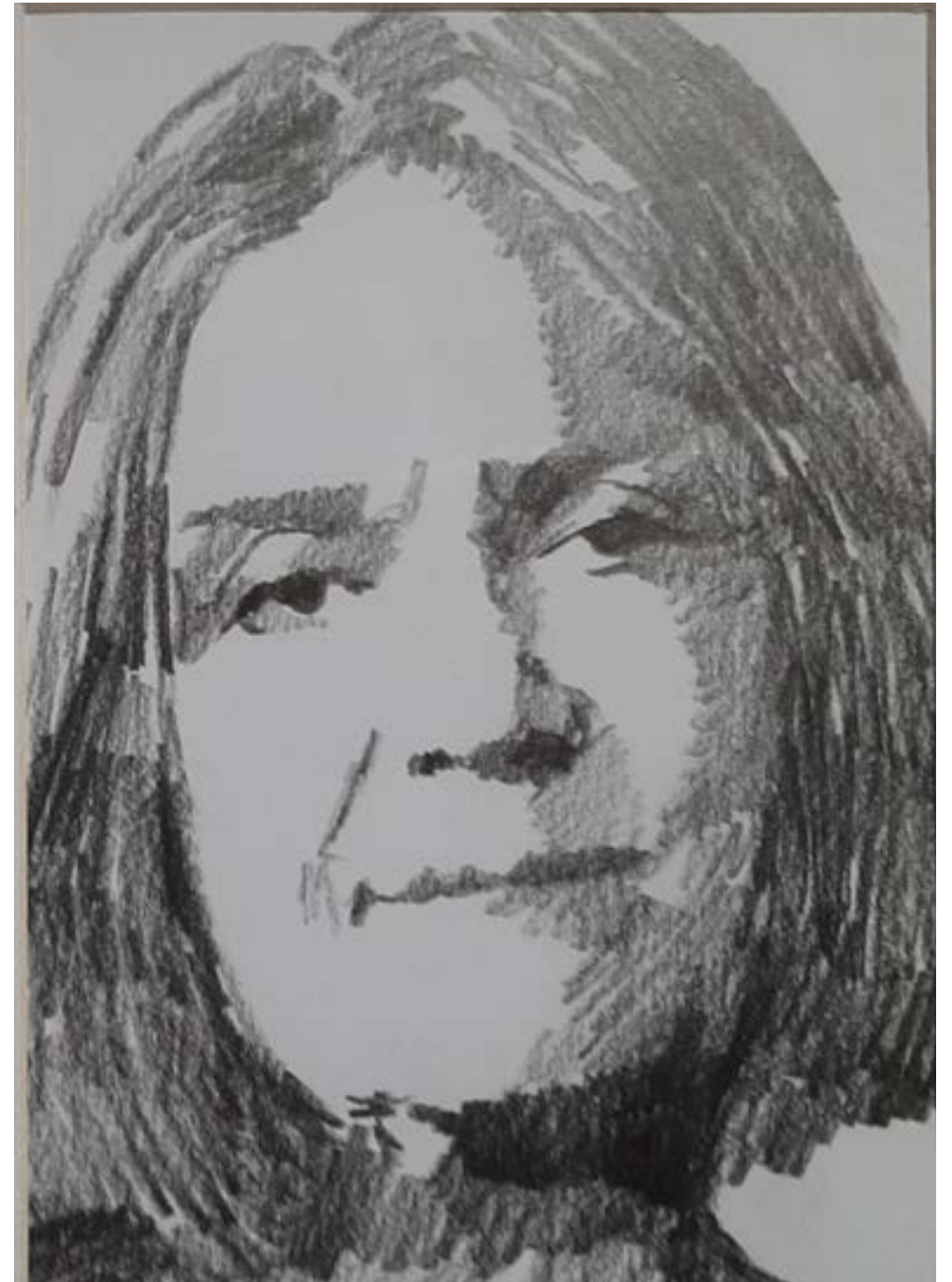
Nawalal Saadawi y Gloria Steinem

El feminismo más que una forma de pensar es una manera de vivir, un ser empático que se esfuerza por el bienestar de la sociedad, respeto exigible basado en igualdad para llegar a una sociedad libre. Una lucha que se vive en los textos pero que debe retumbar en los oídos de todos.