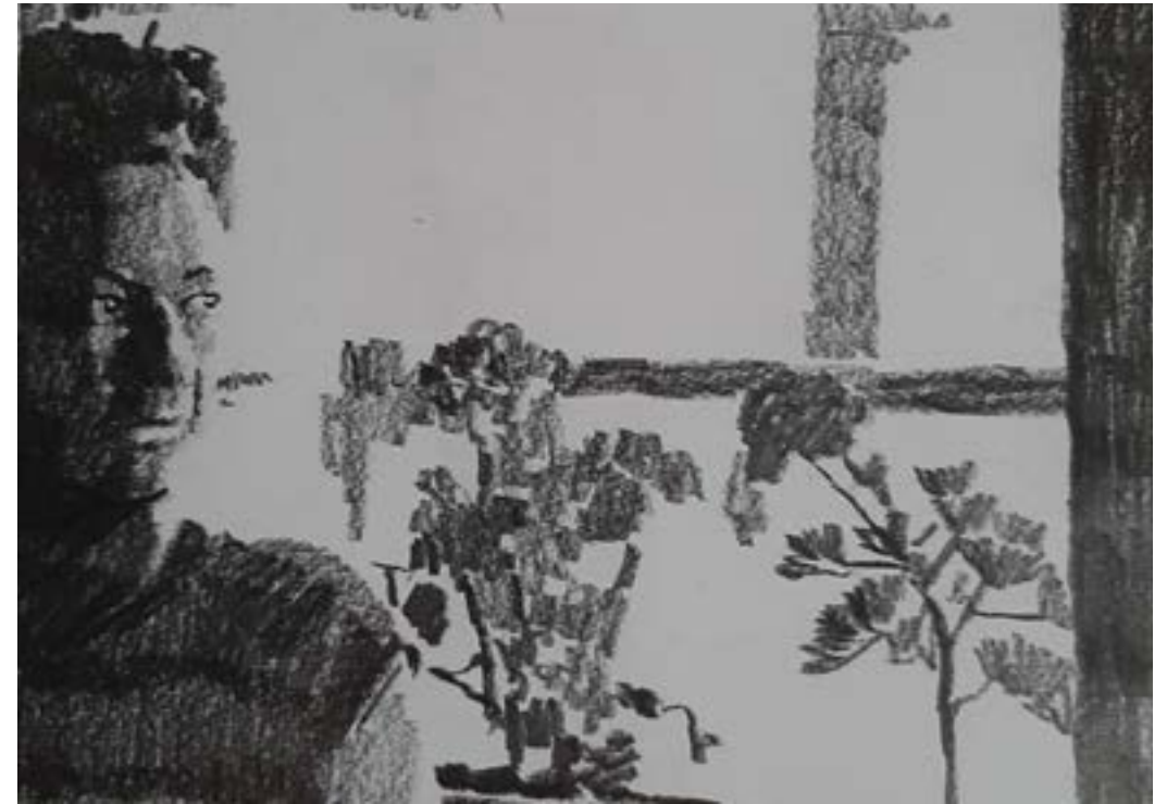
Carmen Conde, primera académica de la RAE.