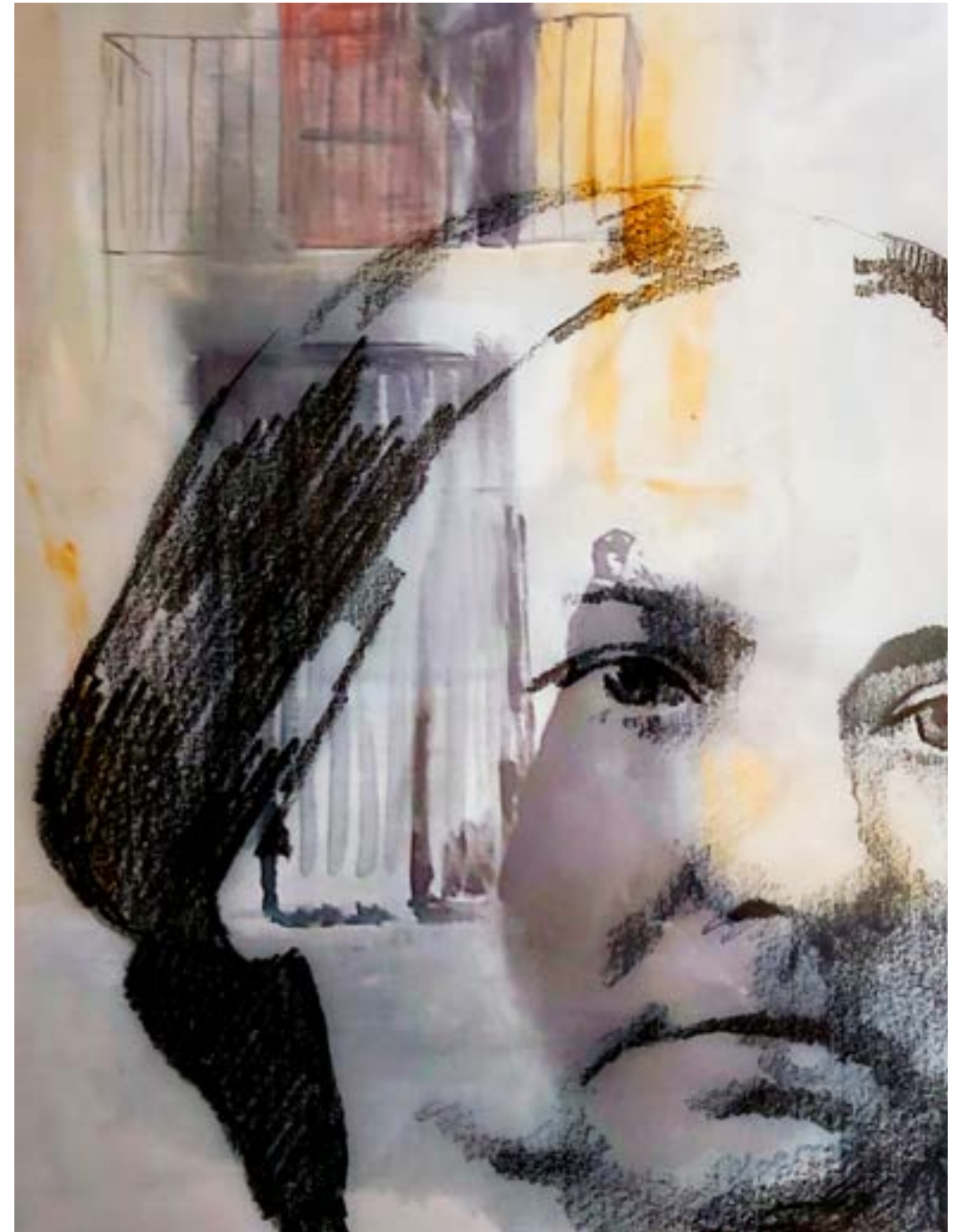
Técnicas variadas, dando mayor protagonismo al dibujo.

En esta exposición hay también pintura, varios acrílicos, acuarelas y algún óleo sobre telas, pero siempre con una fuerte base de dibujo e incluso cediendo todo protagonismo al trazo y la línea, las manchas en algunas obras refuerzan los fondos, pero en la mayoría adquieren un protagonismo secundario.