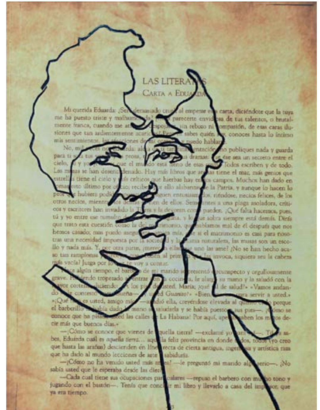
Rosalía de Castro. Comienzo de su Carta a Eduarda .

Toda la carta está expresada de forma irónica. Es una herramienta que sirve para reivindicar, de una forma sutil, el trabajo de las escritoras, pero sin consecuencias; desde una lectura recta no se la puede acusar de que el texto motive, de alguna manera, a las mujeres a escribir.