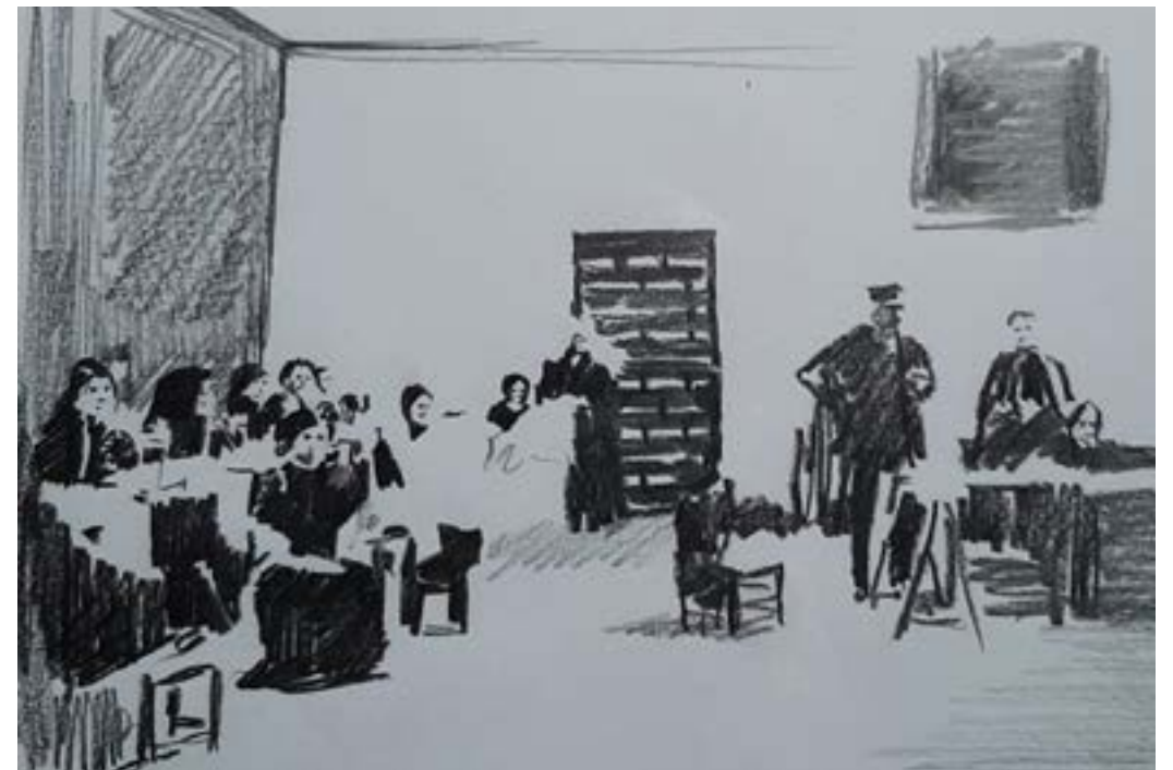
Cárcel de Mujeres de Ventas, donde se inspiró Dolores Medio para escribir Celda Común .

Dolores Medio es una de las máximas representantes de la literatura social en España. Fue ganadora del Premio Nadal en 1952 con su obra Nosotros, los Rivero . Hoy, desgraciadamente, es casi una desconocida, a pesar de que su obra literaria es abundante y variada. Escribió unos 25 volúmenes, aparte de sus obras inéditas como las novelas infantiles ( Modelo de madres y Entre abrazos ) o de adolescencia ( Mi compañera ). A las que hay que añadir las no publicadas, debido a la censura, como Celda Común .