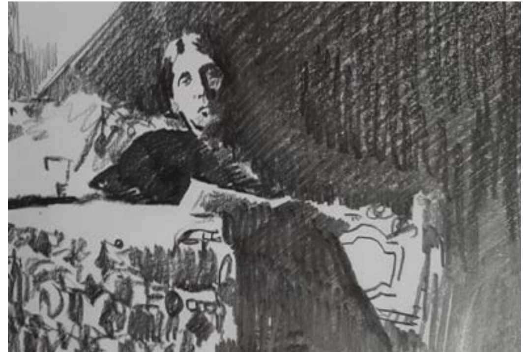
Virginia Woolf leyendo en su estudio.

“Para la mayor parte de la Historia, Anónimo era una mujer” esta cita de la escritora Virginia Woolf, es una crítica directa a la invisibilización que ha tenido la mujer en la historia. Las mujeres tuvieron que luchar contra el lugar que se les tenía asignado, el mundo doméstico. Muchas optaron por el convento para poder ejercer su oficio, mientras que otras hacían uso del pseudónimo.