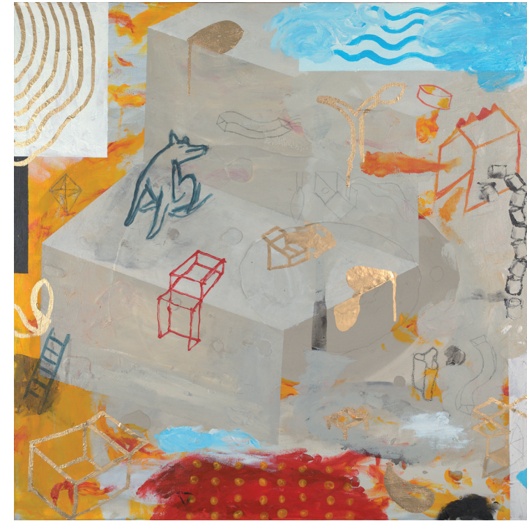
INDIFERENCIA POR ALVAR AALTO 2020-21 TÉCNICA MIXTA SOBRE LIENZO 80X80 cm