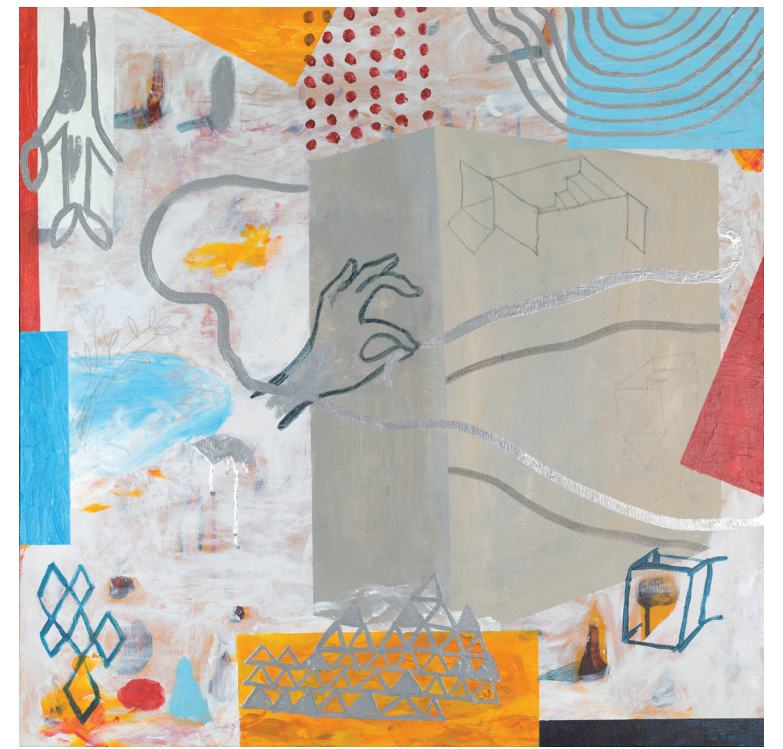
CONCRETO 2020-21 TÉCNICA MIXTA SOBRE LIENZO 80X80 cm