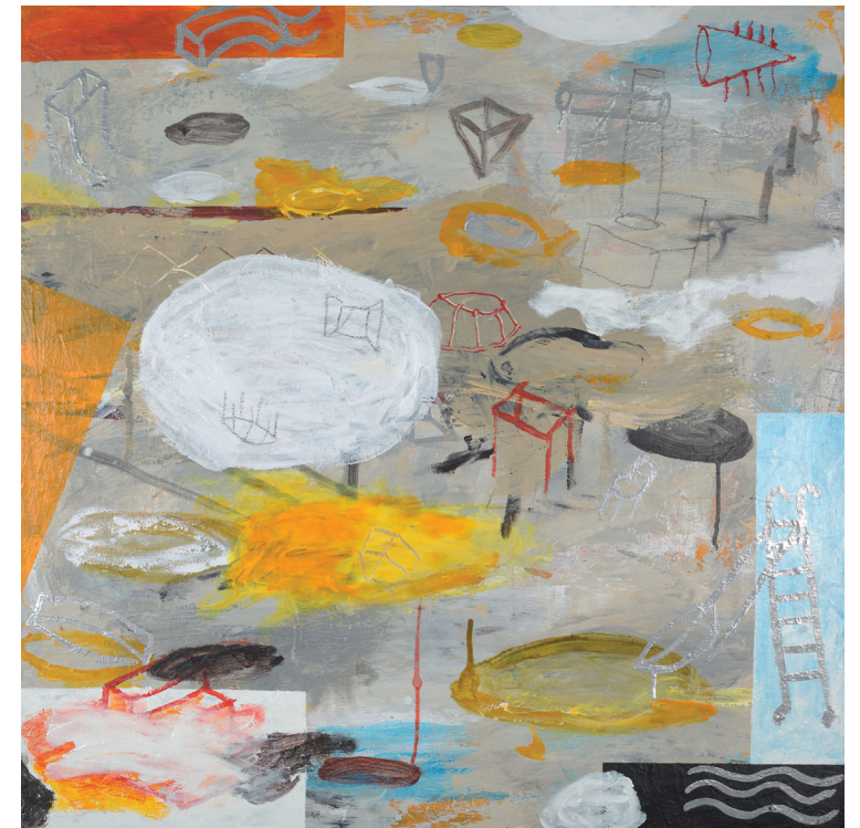
SUEÑO RUIDOSO 2020-21 TÉCNICA MIXTA SOBRE LIENZO 80X80 cm