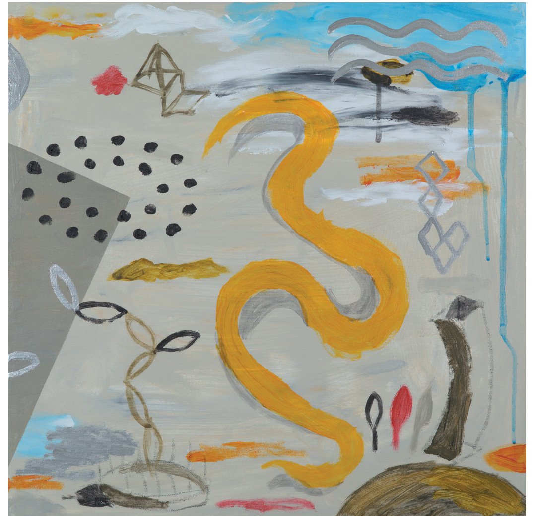
SOPOR JUNTO AL MAR 2021 TÉCNICA MIXTA SOBRE LIENZO 50X50 cm