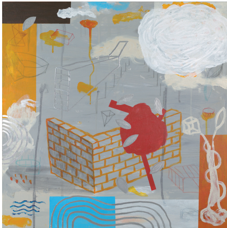
DENTRO Y FUERA 2 2021 TÉCNICA MIXTA SOBRE LIENZO 80X80 cm