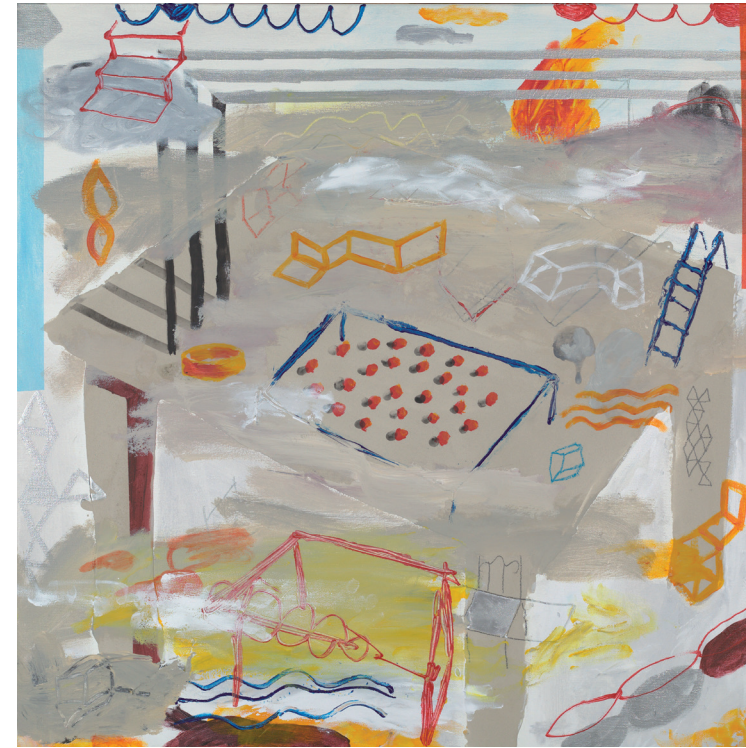
DIÁLOGO ENTRE SILLA Y ESCALERA 2020-21 TÉCNICA MIXTA SOBRE LIENZO 80X80 cm