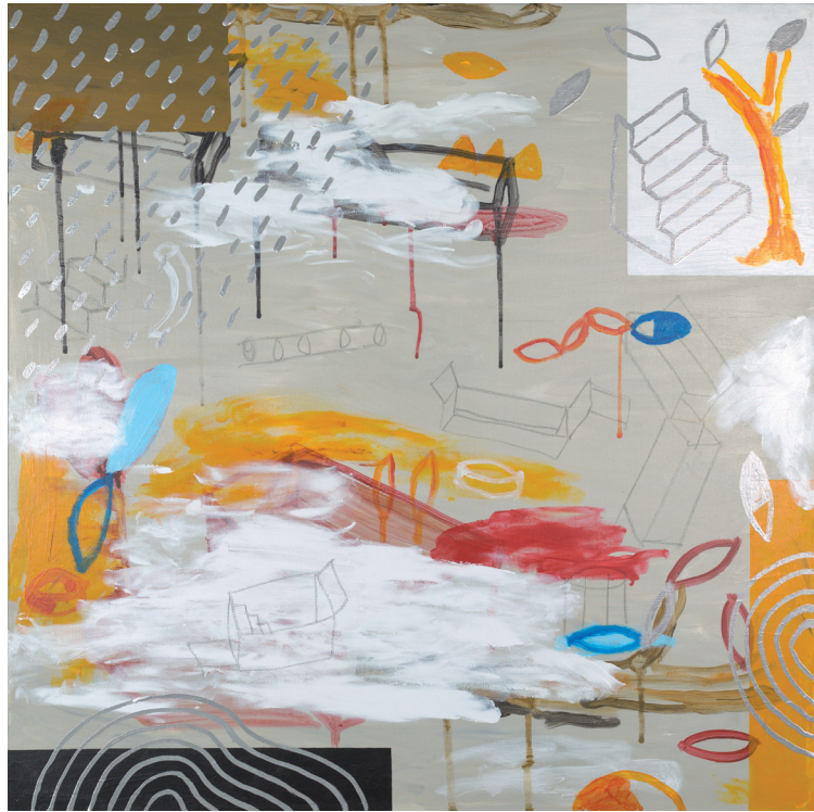
LA BUENA VIDA 2021 TÉCNICA MIXTA SOBRE LIENZO 90X90 cm