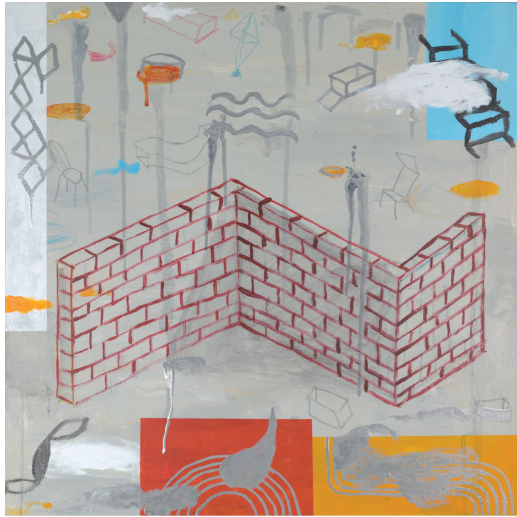
DENTRO Y FUERA 1 2021 TÉCNICA MIXTA SOBRE LIENZO 80X80 cm