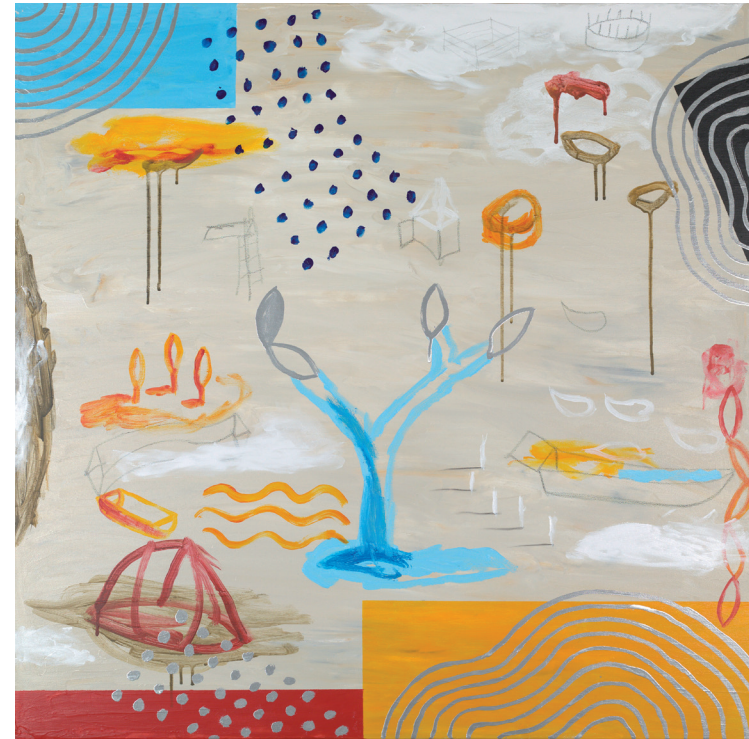
BROTE 2021 TÉCNICA MIXTA SOBRE LIENZO 90X90 cm