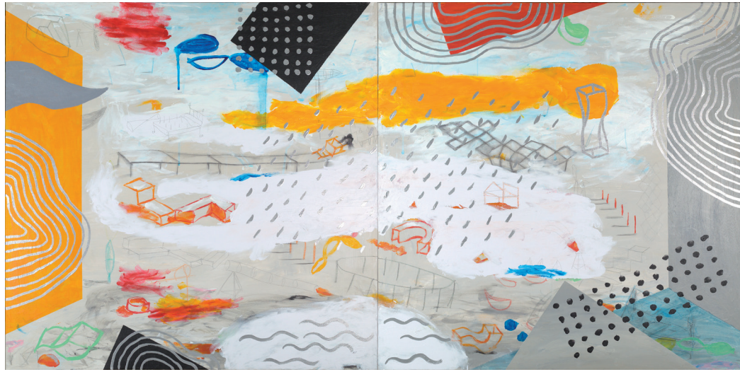
PAISAJE Y TORSIÓN 2020 TÉCNICA MIXTA SOBRE LIENZO 180X90 cm