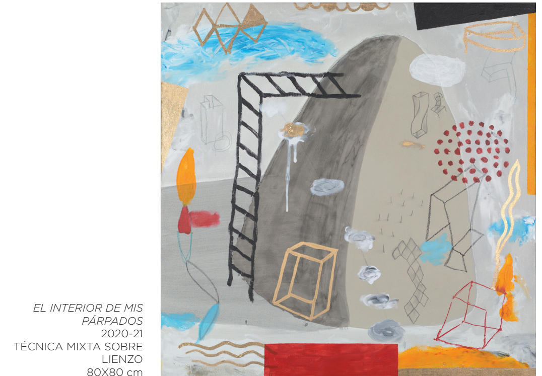
EL INTERIOR DE MIS PÁRPADOS 2020-21 TÉCNICA MIXTA SOBRE LIENZO 80X80 cm