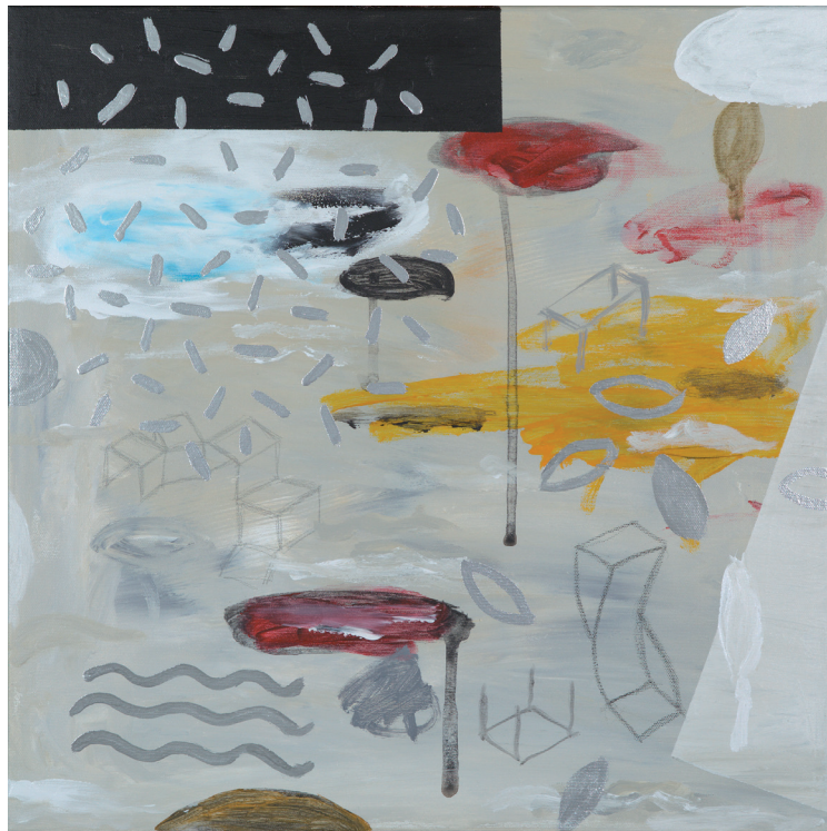
ARPEGGIO 3 2021 TÉCNICA MIXTA SOBRE LIENZO 50X50 cm