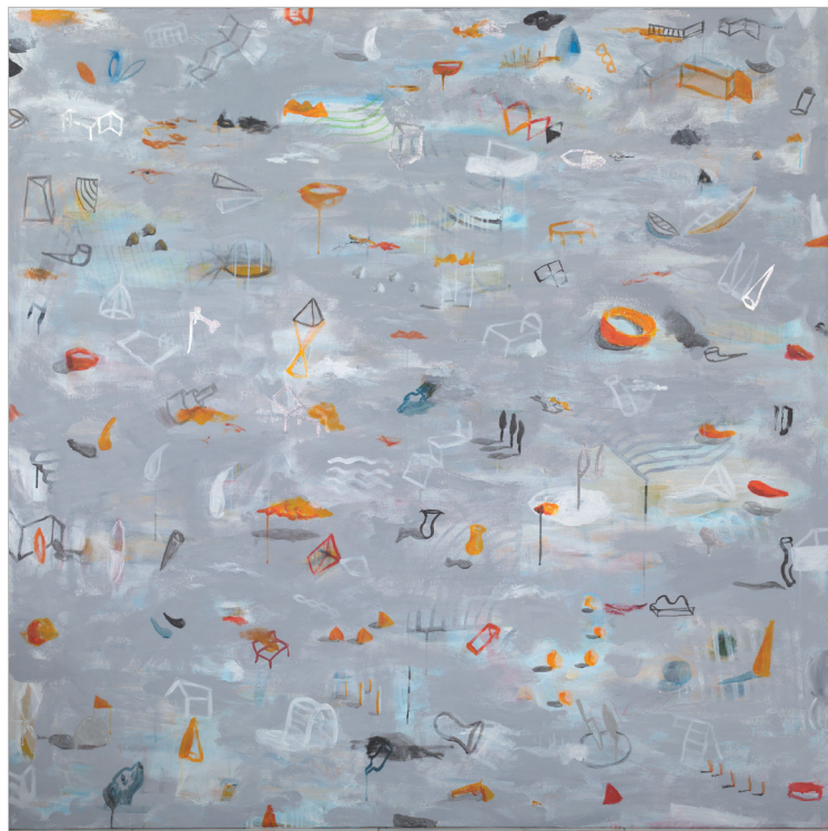
PERRO SEMIHUNDIDO (DE GOYA) Y OTRAS COSAS 2017-18 TÉCNICA MIXTA SOBRE LIENZO 150X150 cm