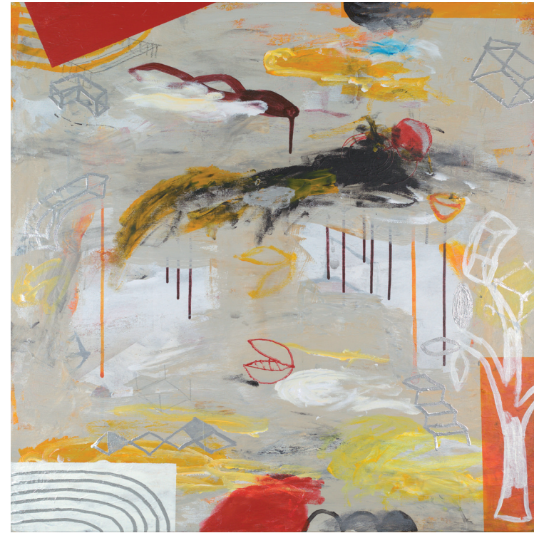
NADA ME PREOCUPA 2020-21 TÉCNICA MIXTA SOBRE LIENZO 80X80 cm