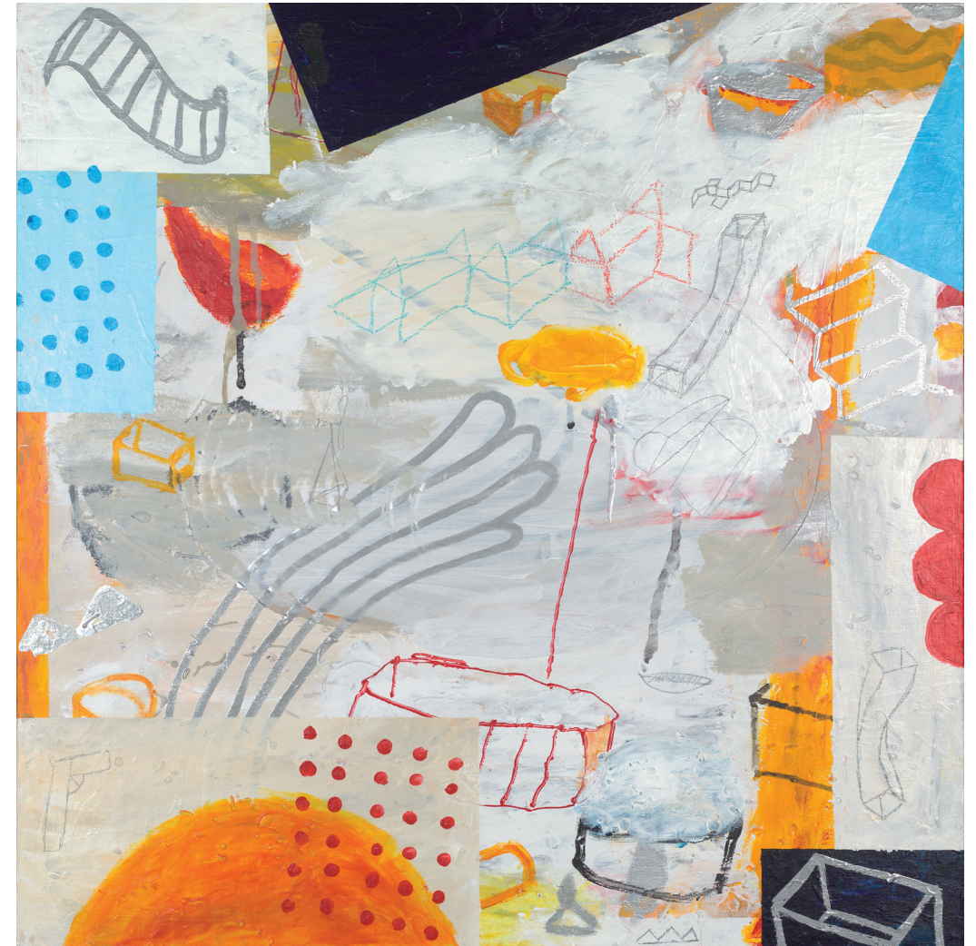
ADOSADOS 2020-21 TÉCNICA MIXTA SOBRE LIENZO 80X80 cm