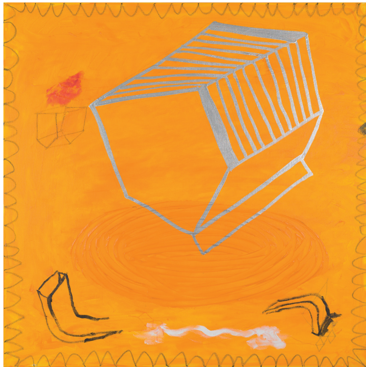
REM 1 2020-21 TÉCNICA MIXTA SOBRE LIENZO 80X80 cm