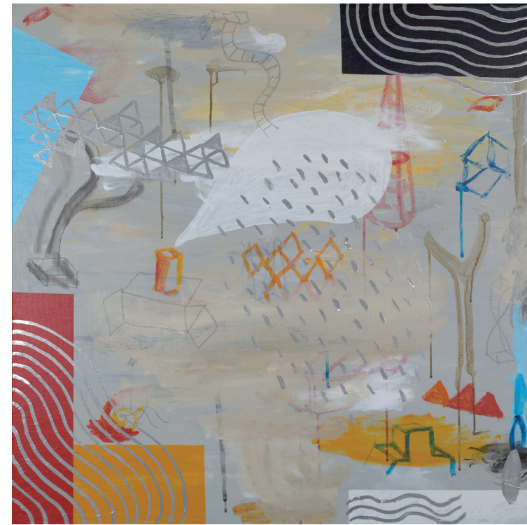
SUEÑO CON NAUTILUS 2021 TÉCNICA MIXTA SOBRE LIENZO 90X90 cm