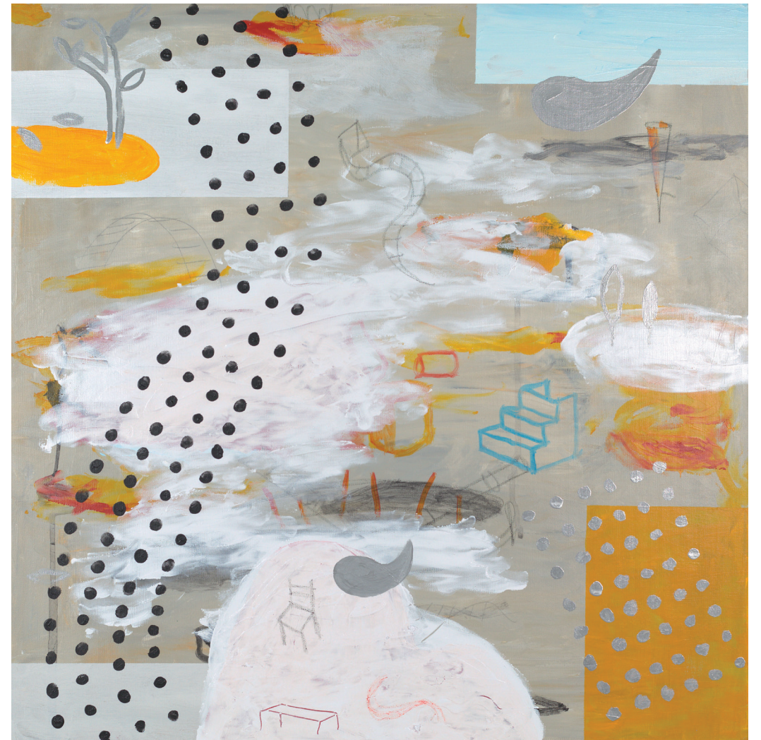
SIESTA 2021 TÉCNICA MIXTA SOBRE LIENZO 80X80 cm