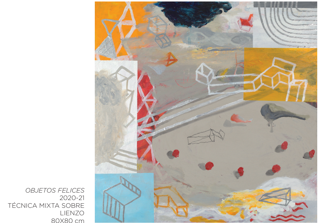
OBJETOS FELICES 2020-21 TÉCNICA MIXTA SOBRE LIENZO 80X80 cm