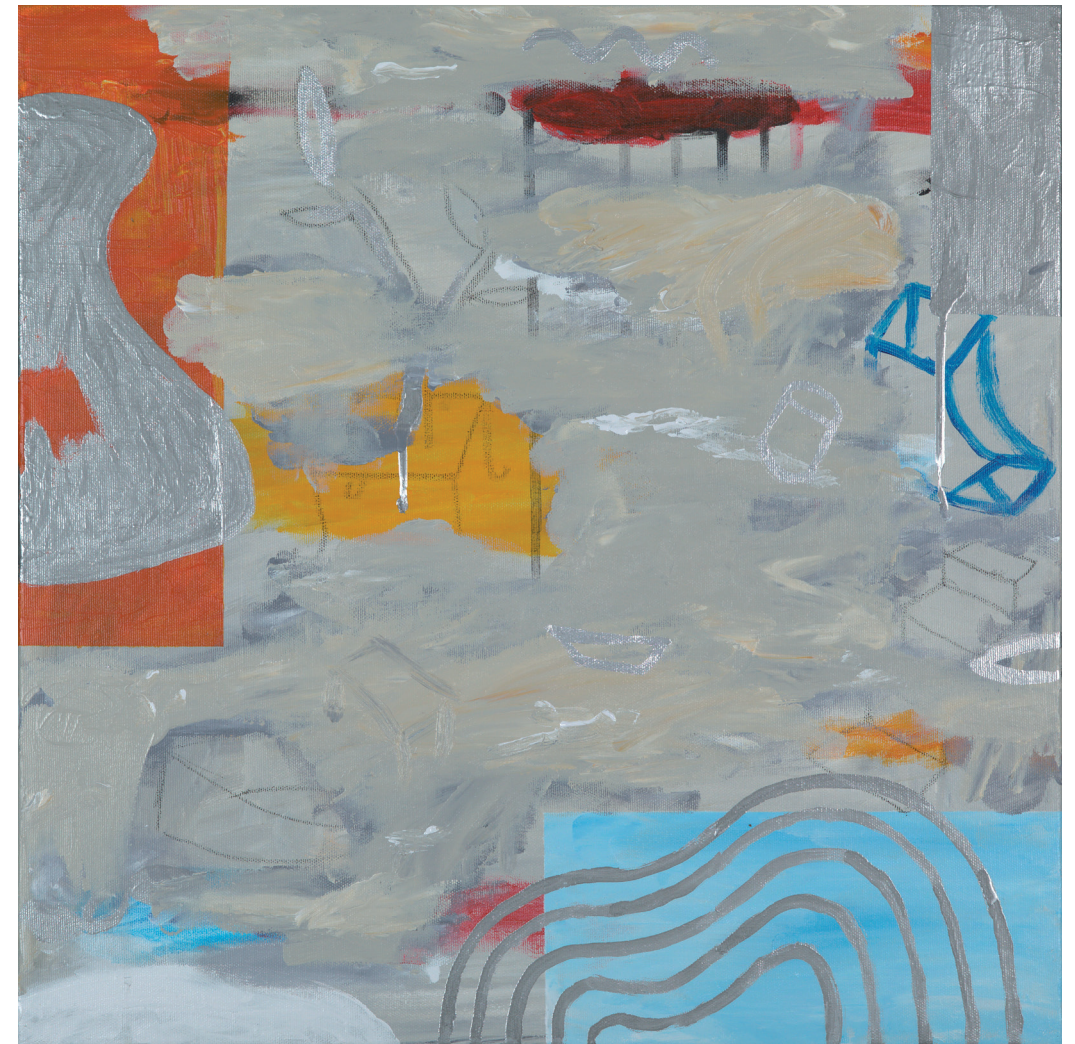
ARPEGGIO 1 2021 TÉCNICA MIXTA SOBRE LIENZO 50X50 cm

La trayectoria del pintor es larga y evolutiva, recuerdo aquellas primeras pinturas oscuras con formas grandes y rotundas que ocupaban todo el lienzo, más tarde líneas gruesas, rayas, colores rabiosos, intensos, sus formas cada vez más esquemáticas... el artista va evolucionando, madurando y su obra actual, de objetos más pequeños, se ha hecho más grande.