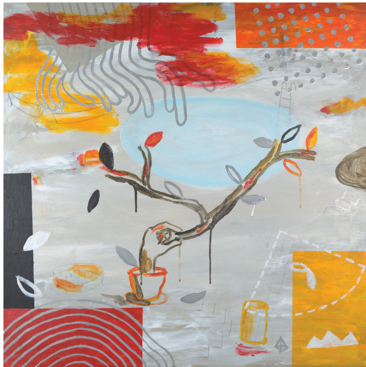
MIENTRAS SUEÑO CON CHINASKI 2021 TÉCNICA MIXTA SOBRE LIENZO 90X90 cm