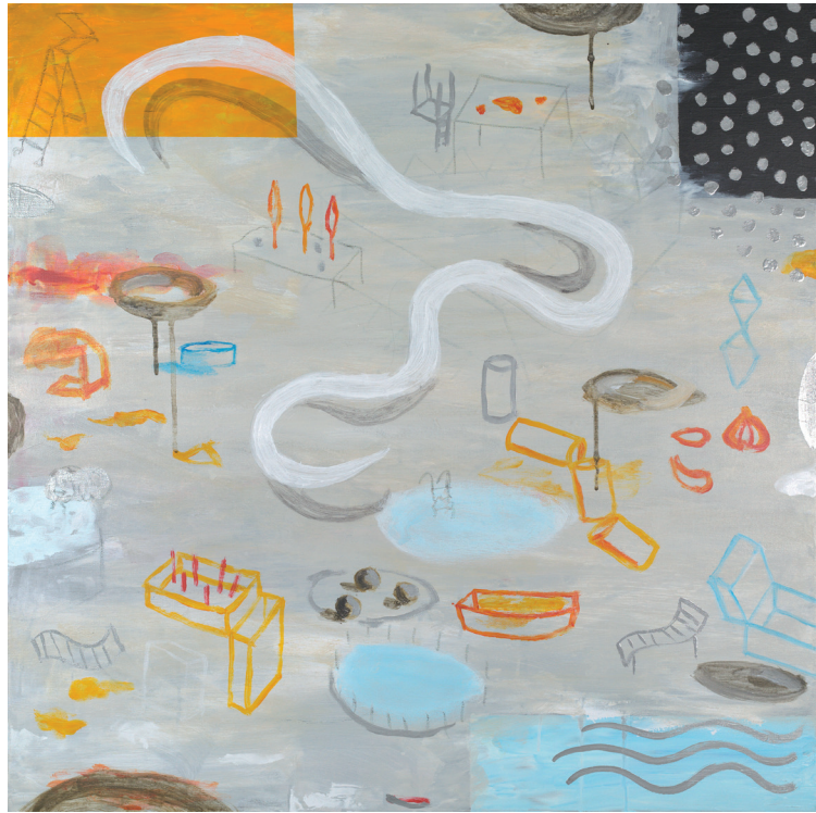
SUTIL SUEÑO CON AJOS 2021 TÉCNICA MIXTA SOBRE LIENZO 90X90 cm