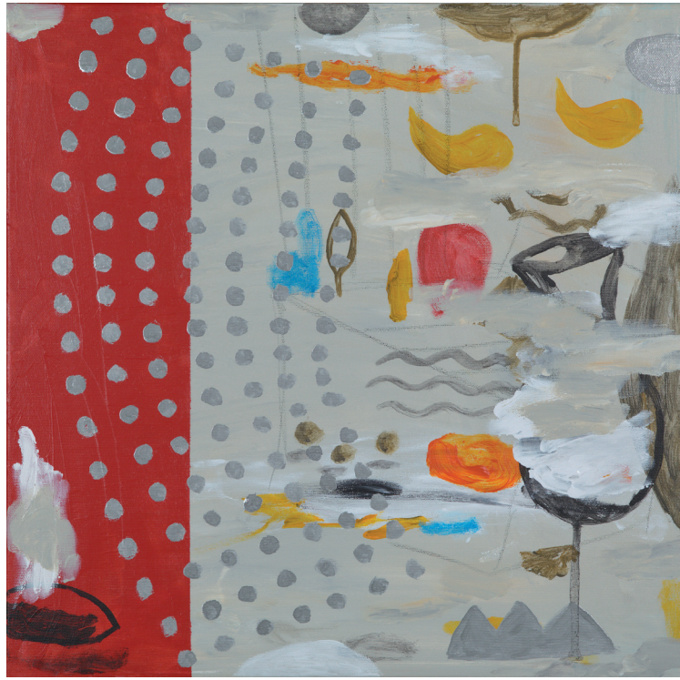
ARPEGGIO 2 2021 TÉCNICA MIXTA SOBRE LIENZO 50X50 cm