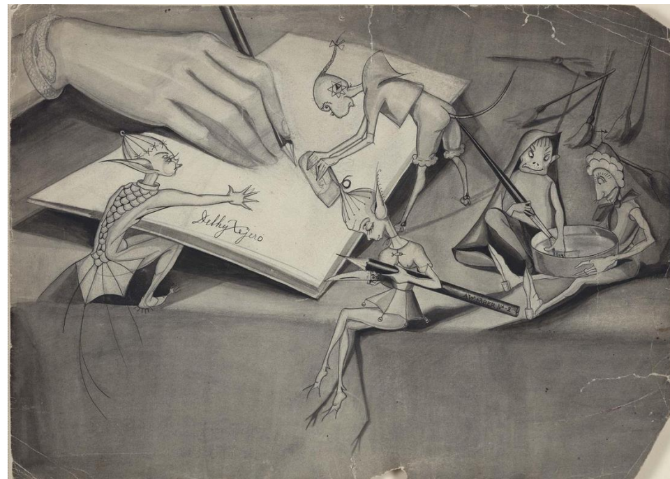
Imagen 3. Delhy Tejero (1929) Las brujas con Delhy Tejero. Tinta, gouache y lápiz sobre cartulina.